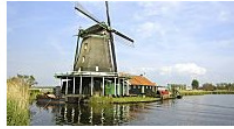
Eine Reise wert: Ferienunterkünfte der besonderen Art