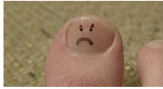
Gelbe Fußnägel: Was kann das sein?