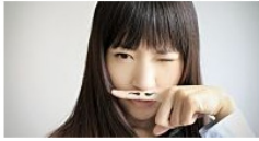
Lästige Härchen: Der Damenbart muss ab!