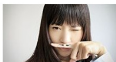
Lästige Härchen: Der