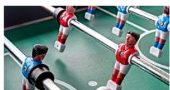
Top-Duelle am 3. Spieltag der