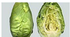
Spitzkohl: Zubereitung und