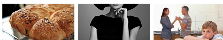
Was bringen Damenmode: Das sind die Scheidung – wie erklärt man